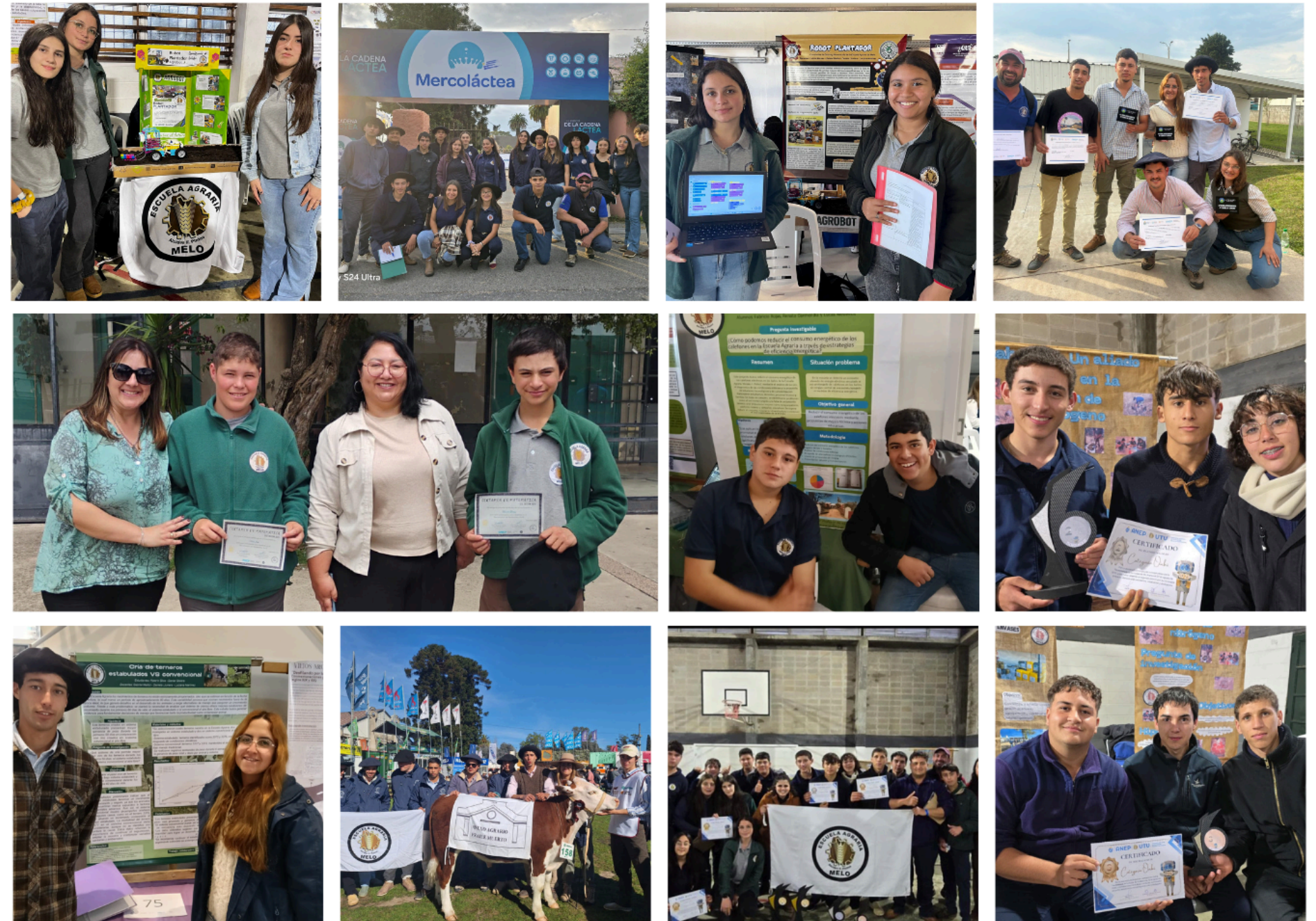
Participación en concursos y ferias tecnológicas:

Los estudiantes participan en Ferias Tecnológicas, TechniCiencias y Clubes de Ciencia, en áreas: tecnológica, científica y social, promoviendo la innovación y el trabajo colaborativo.