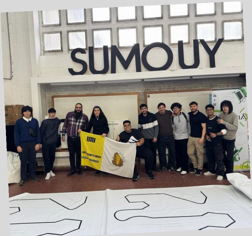
Facultad de Ingeniería

Exposiciones y presentaciones en la escuela y en coordinación con otros centros educativos.