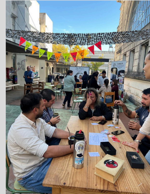
Espacio de coordinación