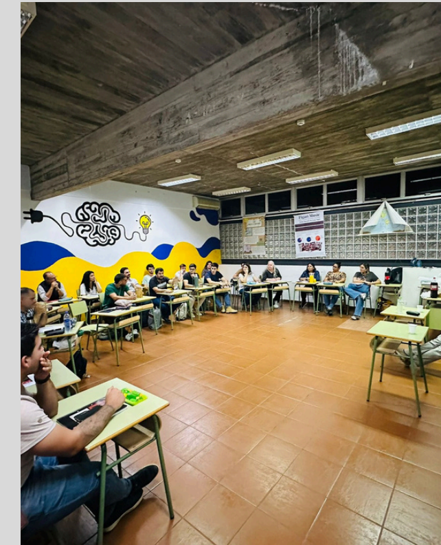
Encuentro con profesionales