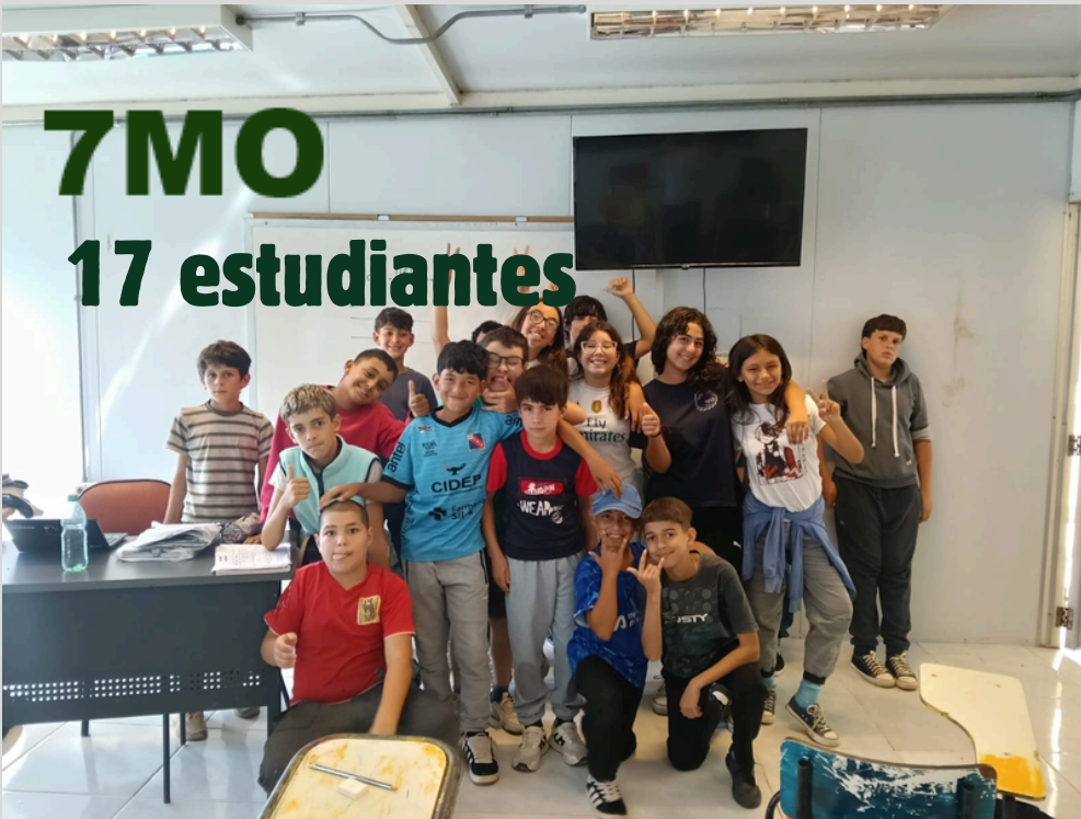
7MO 17 estudiantes