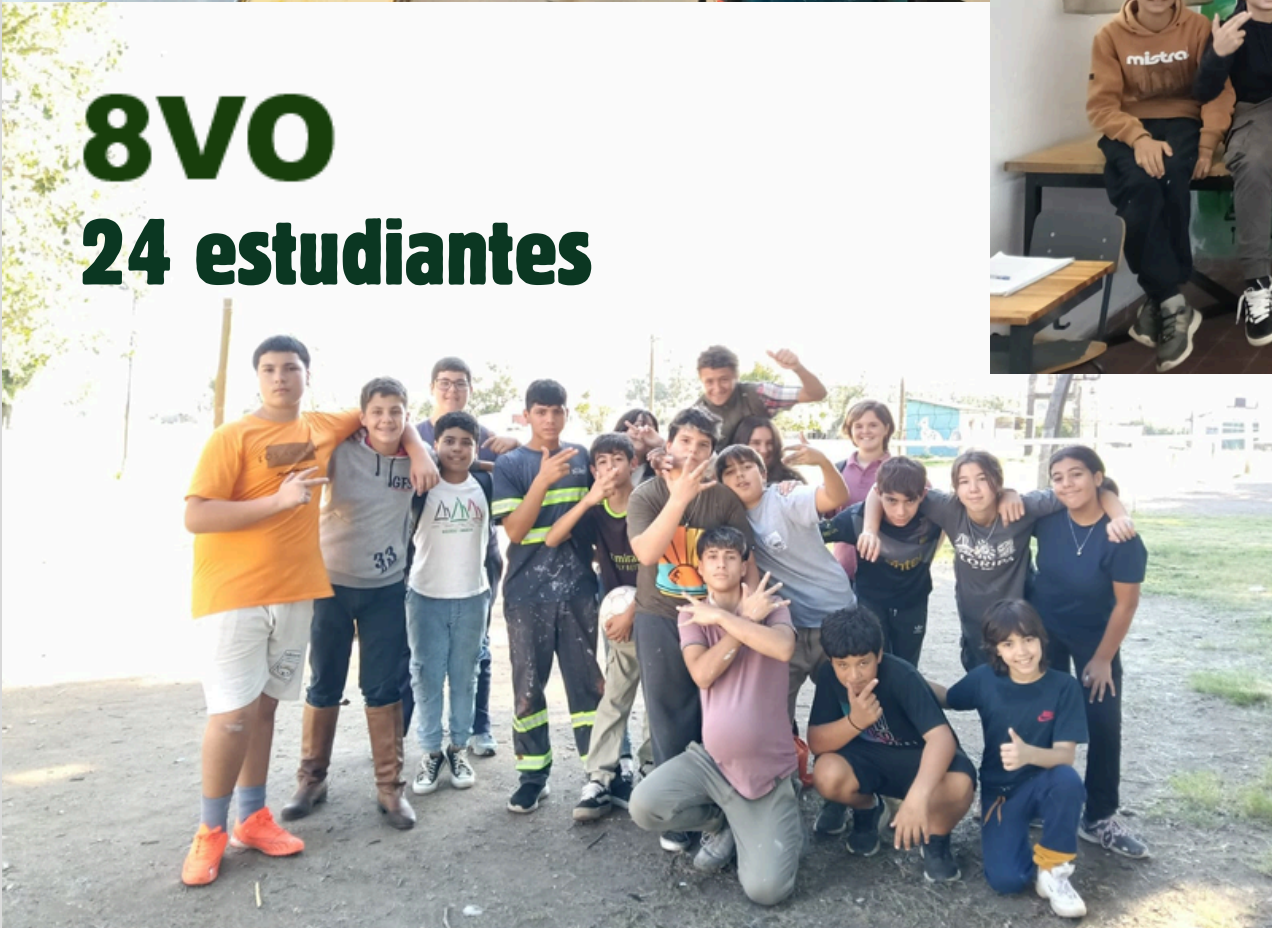
8VO 24 estudiantes