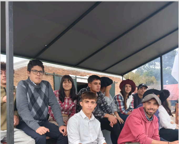
2DO 17 estudiantes