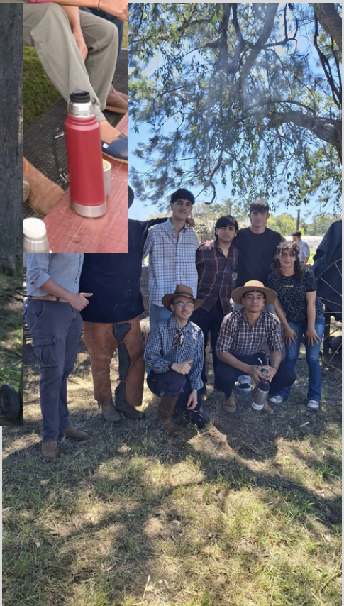
3ERO 8 estudiantes