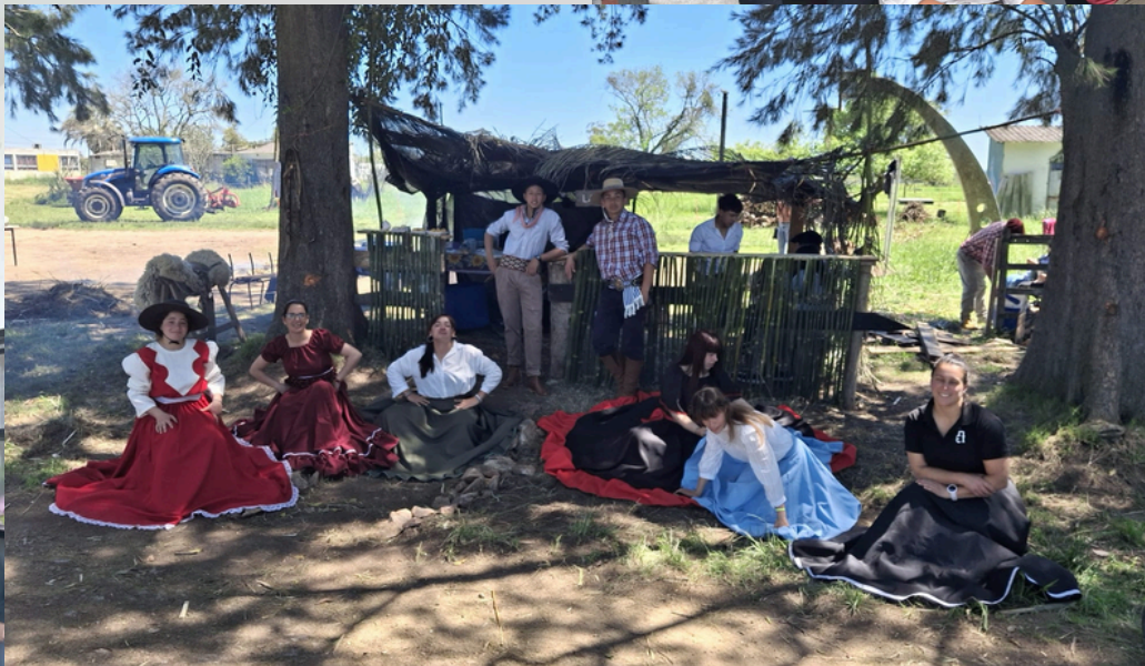
1ERO 19 estudiantes