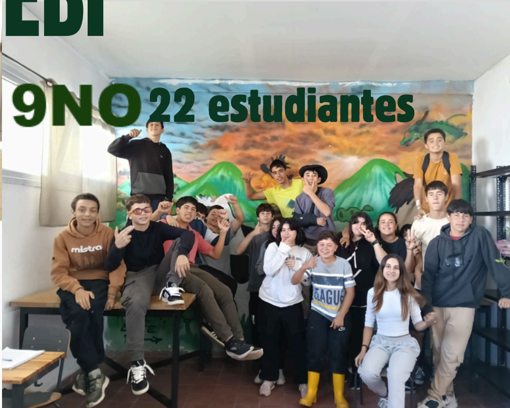
9NO 22 estudiantes