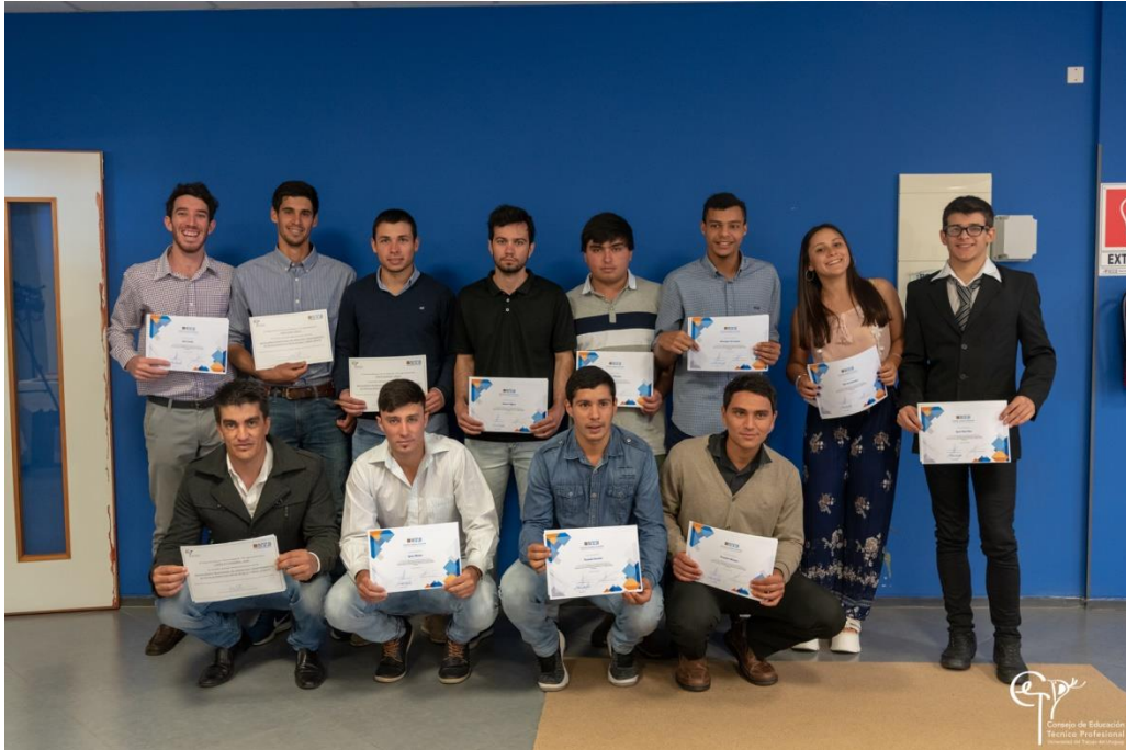
Egresados del curso de Operación y Mantenimiento de Instalaciones Eléctricas en baja y media tensión