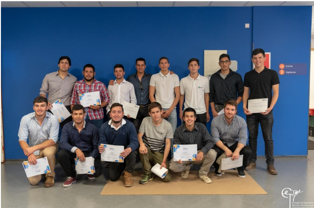
Egresados del curso de Operación y Mantenimiento de Instalaciones de transmisión